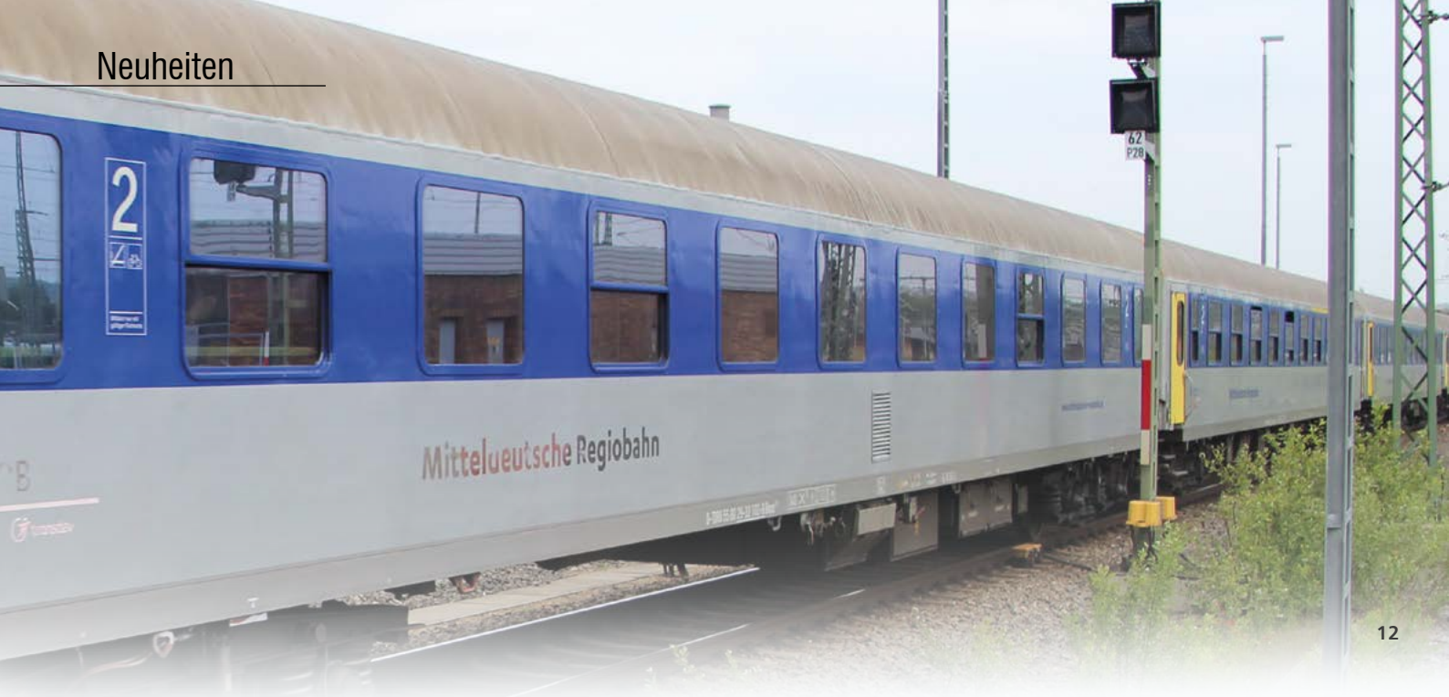
Abb. 12: Halberstädter Reisezug- wagen der Mitteldeut- schen Regiobahn.