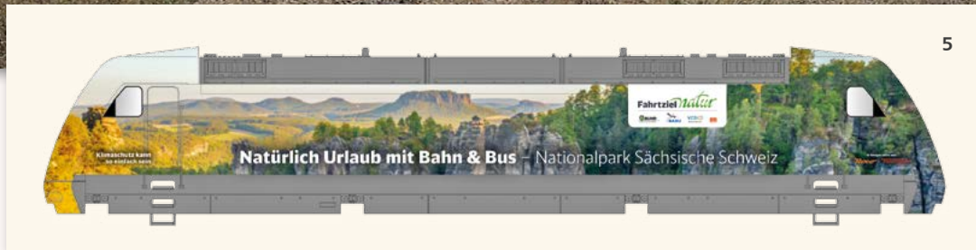
Abb. 5: Skizze einer der beiden Seiten der Ellok BR 101 "Fahrziel Natur", Art. 02321 (mit freundlicher Unterstützung der DB Fernverkehr AG, Fahrziel Natur und der Modelleisenbahn GmbH). Während auf der hier gezeigten Seite der Nationalpark Sächsische Schweiz zu sehen ist, zeigt die andere Seite Motive des Nationalparkes Hohe Tauern.

1980er Jahre als Versuchsträger. Dieser Betriebszustand ist die Basis für unser neues TT-Modell. Aktuell befindet sich die 182 001 im DB Museum Koblenz, wo sie bereits 2013 gemäß ihres Farbkonzeptes der 1980er Jahre optisch aufgearbeitet wurde.